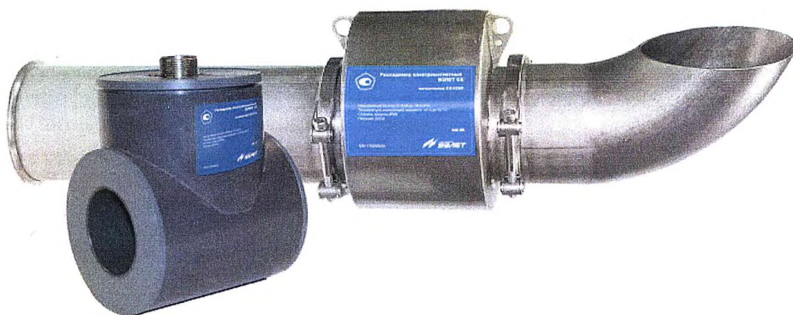
Рисунок 1 – Общий вид расходомеров-счетчиков электромагнитных ВЗЛЕТ СК

Пломбировка от несанкционированного доступа расходомеров-счетчиков электромагнитных ВЗЛЕТ СК осуществляется нанесением знака поверки давлением на свинцовую (пластмассовую) пломбу, установленную на контрольной проволоке, пропущенную через пломбировочные отверстия винтов крепления разъема на корпусе расходомера-счетчика электромагнитного ВЗЛЕТ СК. Схема пломбировки от несанкционированного доступа, обозначение места нанесения знака поверки представлена на рисунке 2.